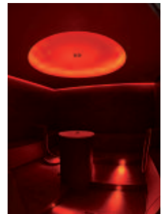
▲ Dampfbad in neuer Gestalt. In rot und in grün