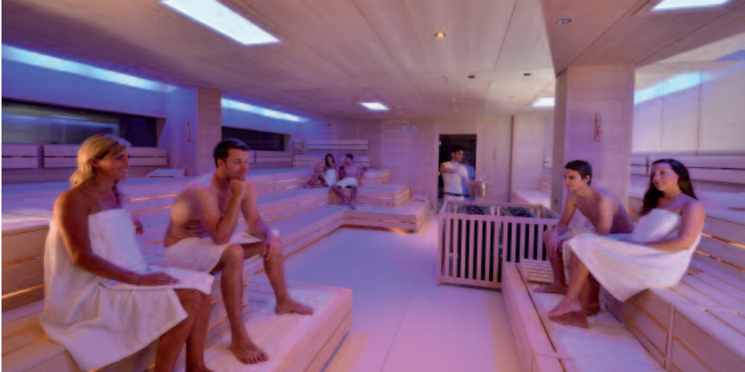
▲ Großraumsauna „Spectaculum“