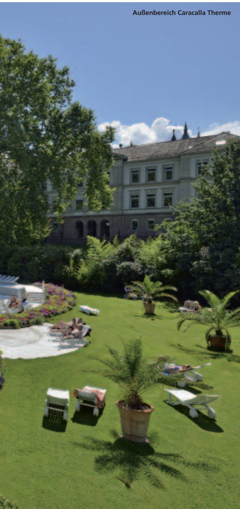
Außenbereich Caracalla Therme

Sitzbreite von 1,00 Meter pro Person. In nur knapp fünf Wochen wurde der alte Saunabereich umgestaltet und Platz für die neue Sauna geschaffen. Bestehend aus extrem haltbarem Hemlock-Holz und indirekter Beleuchtung an den Sitzbänken bringt es Gäste bei 90°C kräftig ins Schwitzen. Freuen dürfen sich die Kunden vor allem auf spektakuläre Erlebnisaufgüsse wie das Titanic Adventure. Mit abgestimmten Licht- und Soundeffekten, ermöglicht durch LED-Beleuchtung in der Decke und einem modernen integrierten Soundsystem, erleben Besucher hier den ganz besonderen Aufguss und – wie der Name vermuten lässt – ein spektakuläres Saunaerlebnis – denn nur saunieren kann ja jeder.