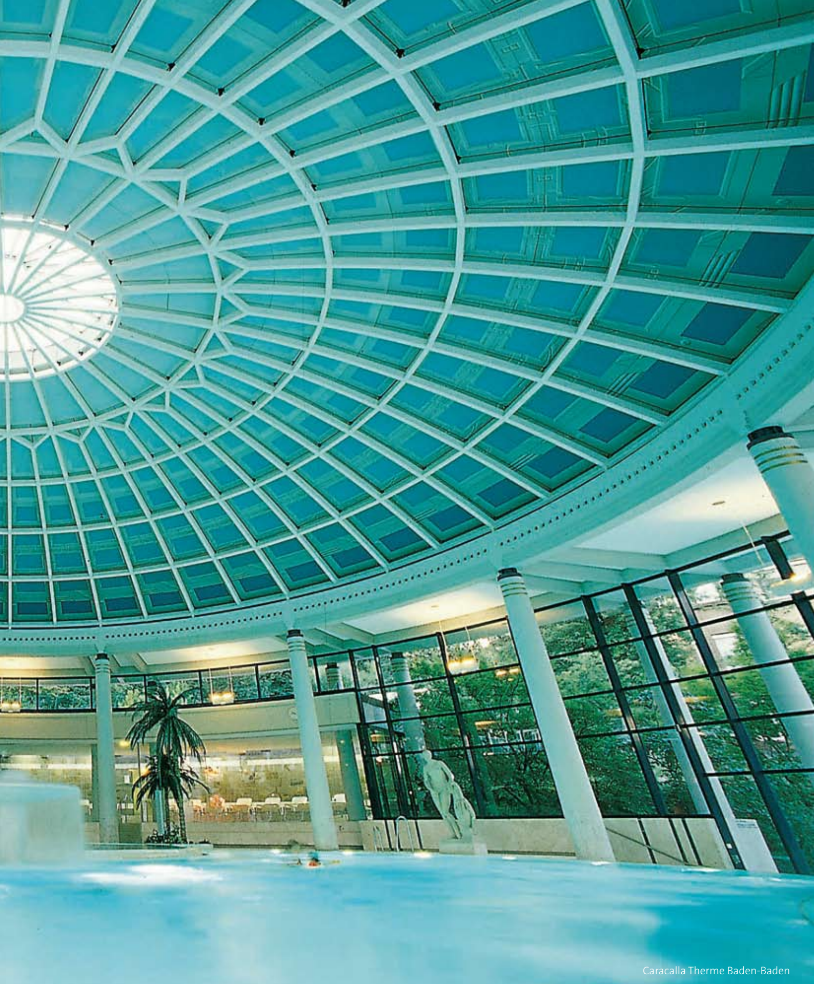
Caracalla Therme Baden-Baden