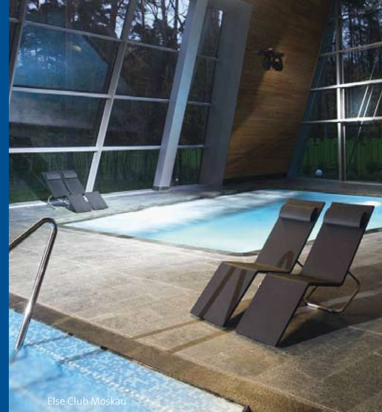
Else Club Moskau