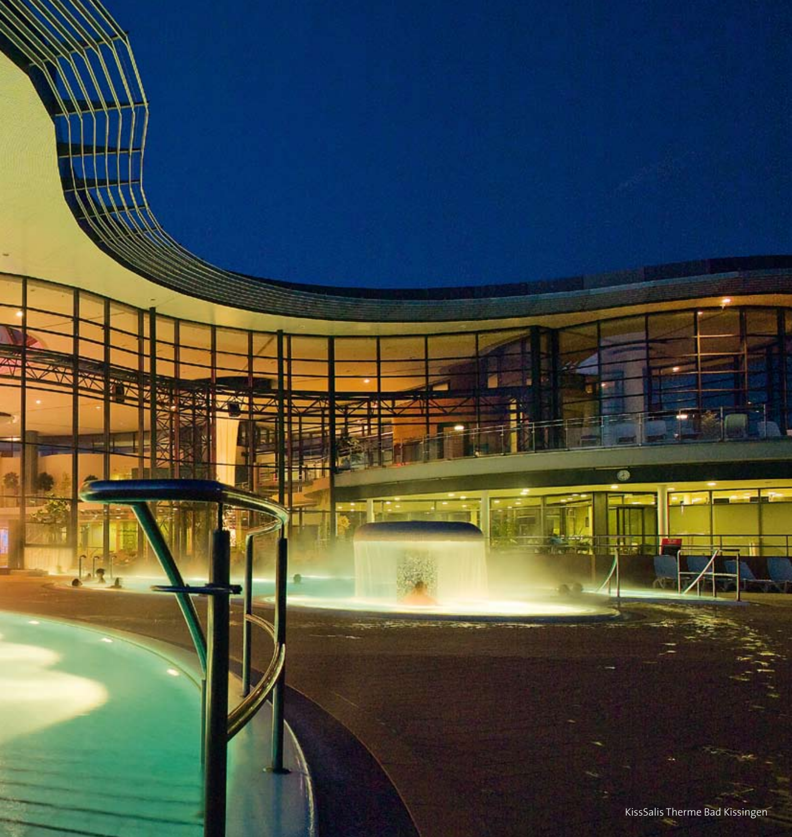
KissSalis Therme Bad Kissingen