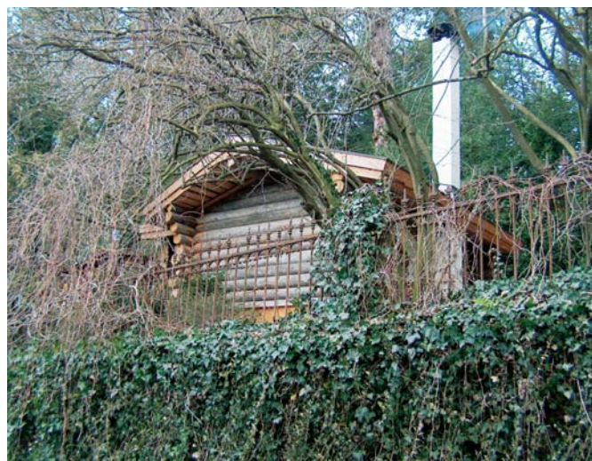
Die Sauna versteckt sich im alten Mammutwald