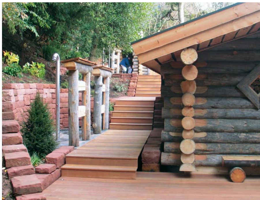
Duschbereich an der Waldsauna