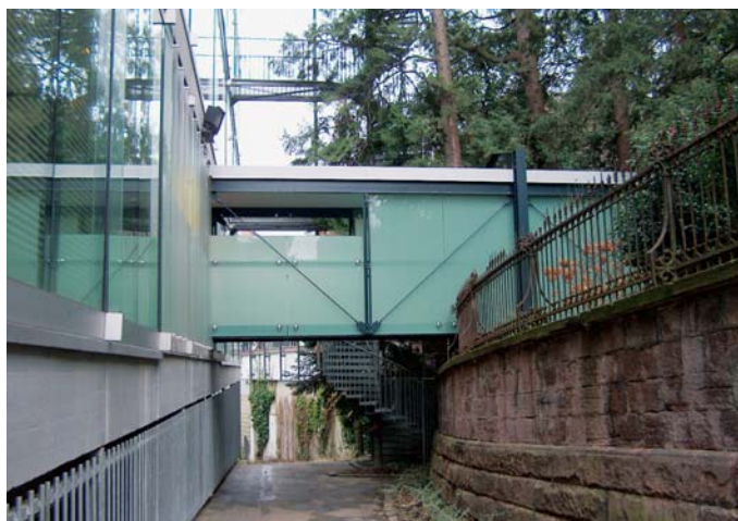
Die Brücke verbindet die Caracalla Therme auch architektonisch mit dem Aussenbereich