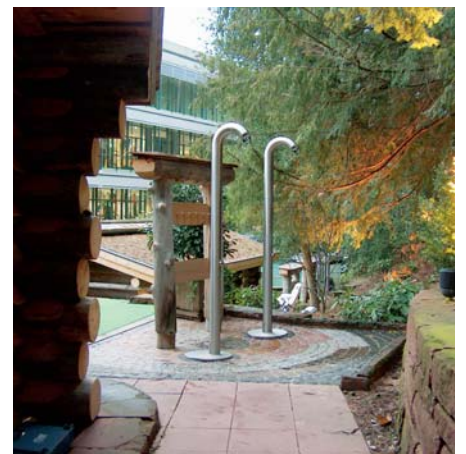
Duschbereich an der Feuersauna