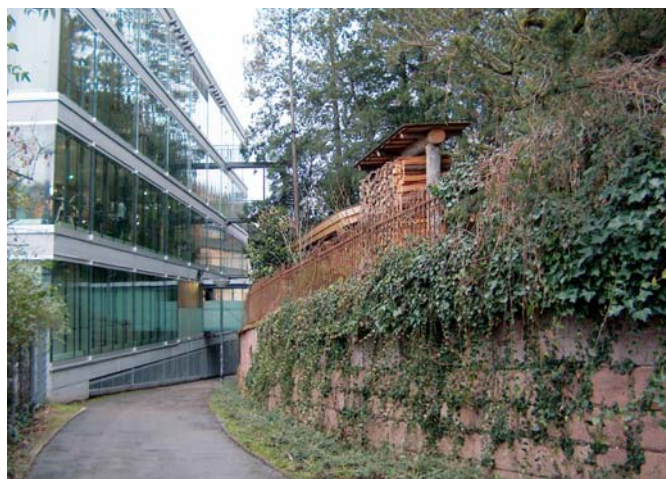
Der Sichtschutz wurde mit Holzstössen gelöst, die auch als Holzlager dienen

Grosszügig gestaltete Ruhebereiche im Schlossgarten unter Mammutbäumen laden zum Ausruhen und Verweilen ein. Die Kaltwasserbereiche bieten Gelegenheit zum Abkühlen nach den Saunagängen. Da der gesamte Bereich unter Natur und Umweltschutz steht mussten insbesondere für die Kanalisation erhöhte Anforderungen erfüllt werden um den Boden vor Verunreinigung zu schützen.