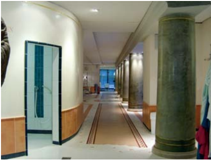
Der neu gestaltete Innenbereich der Sauna in der Caracalla Therme