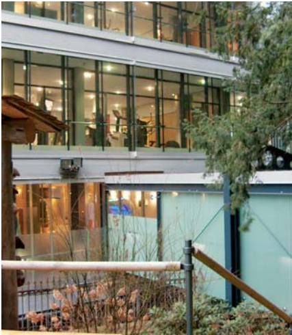
Eine Brücke verbindet die Innensauna mit der Sauna im Schlossgarten