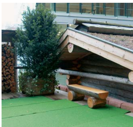
Sitzplatz hinter der Waldsauna