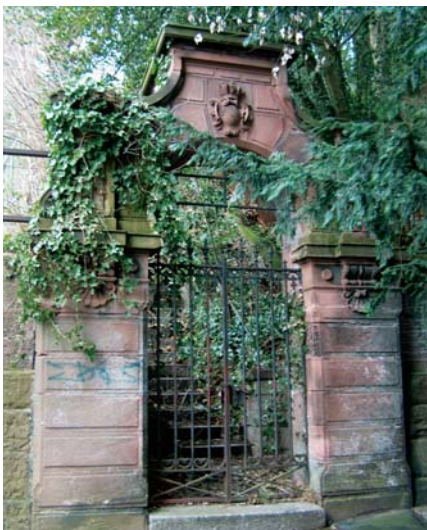
Im Schlossgarten finden sich viele Überreste aus vergangenen Zeiten