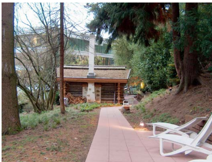
Rückansicht der Feuersauna mit Ruhliegen