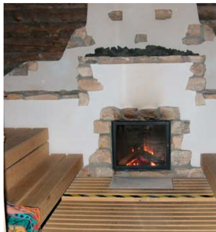
Kamin in der Feuersauna