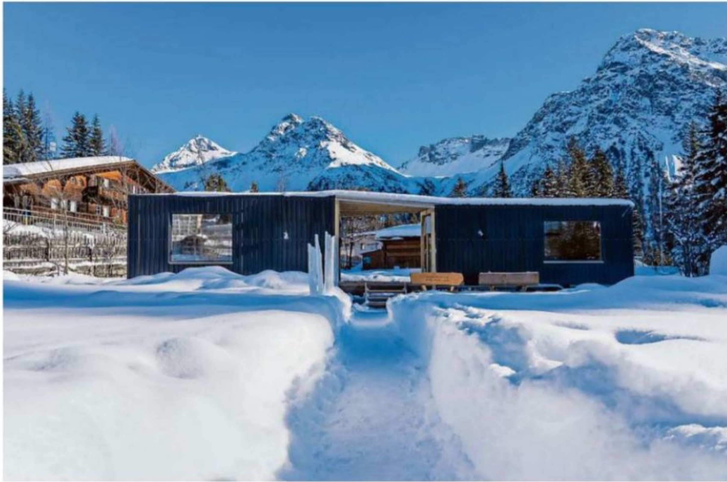
Die Eisbadi erfreut sich einer stetig wachsenden Beliebtheit.