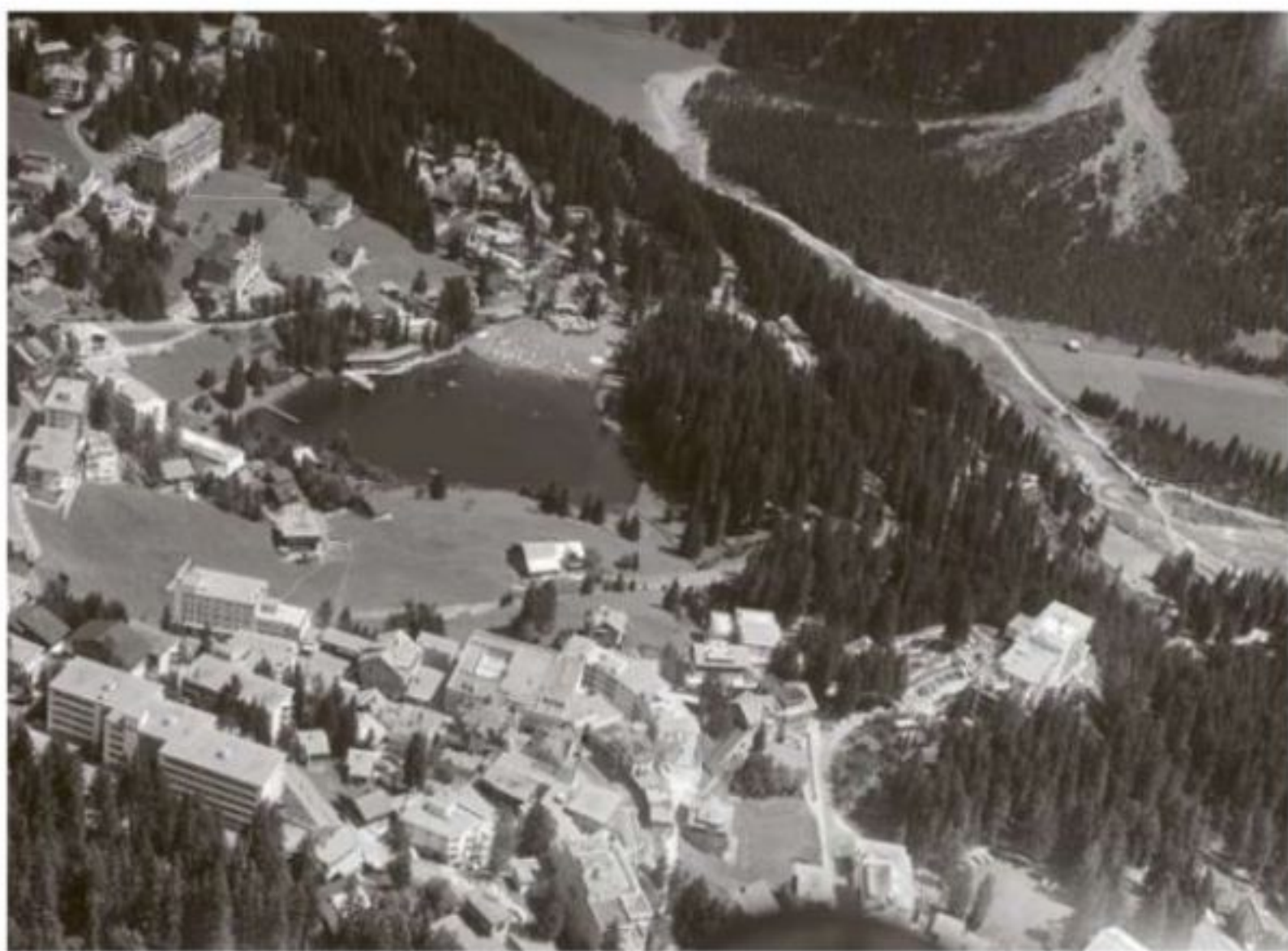
Luftaufnahme vom Untersee, 1969

So weit das Badigebäude – doch wie könnte man den See selbst ausserhalb der Hochsaison im Sommer attraktiver machen? Arosa hat bekanntlich kein Hallenbad, und im Früh- und Spätsommer respektive im Herbst ist das Wasser vielen zu kalt. Auch gibt es den Wunsch, wie in einem klassischen Bad «ganze Bahnen» schwimmen zu können. Möglich machen würde dies der Einbau eines Chromstahlbeckens in den See. Auch dafür wurden verschiedene Varianten geprüft, und man entschied sich, mit einem uferseitig an das natürliche Gelände angepassten Becken im Bereich des jetzigen Nichtschwimmerbereichs in die weitere Planung zu gehen. Ein solches Becken wäre mindestens 25 Meter lang