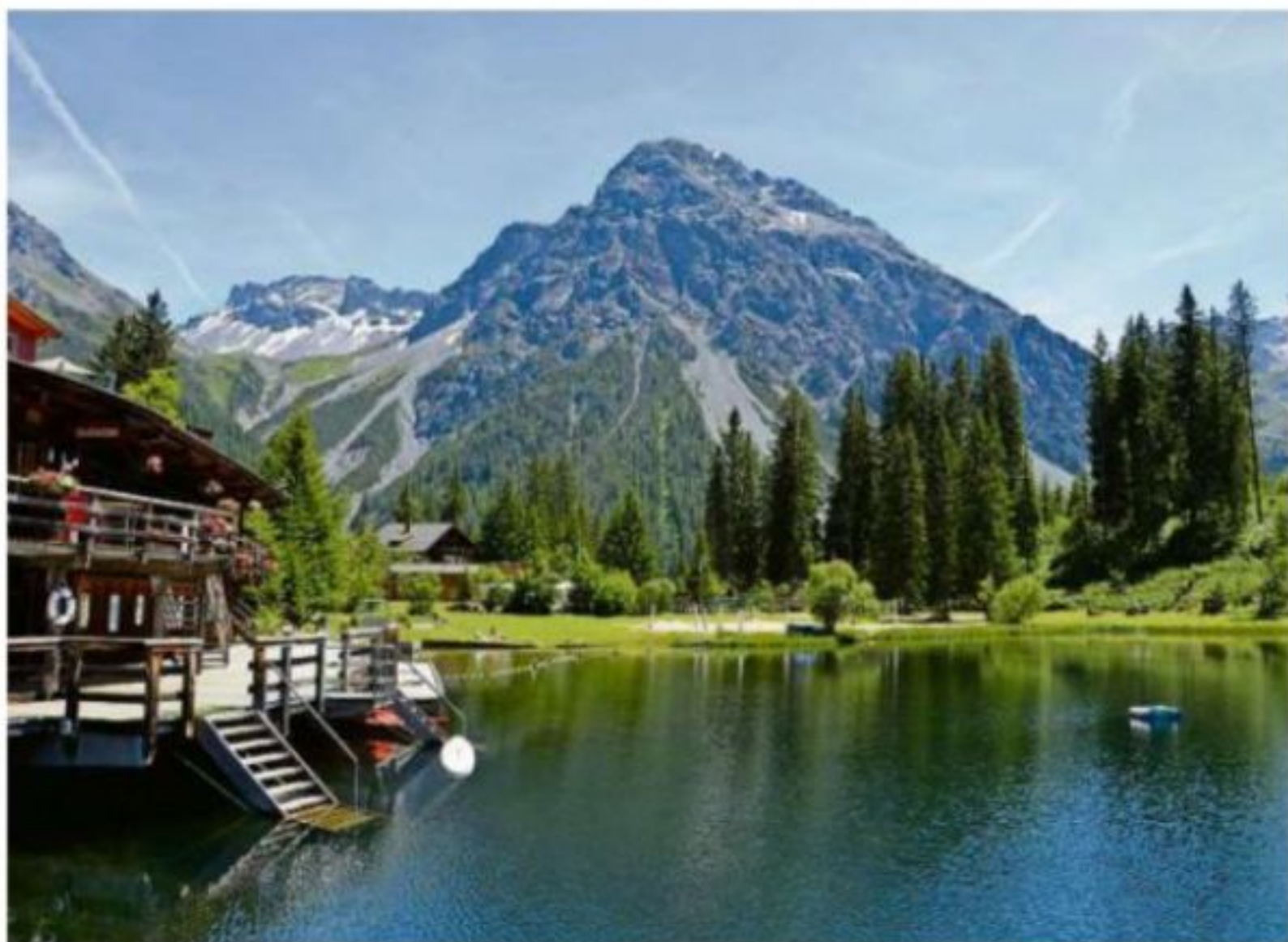
Badi mit Traumkulisse – einfach schön.