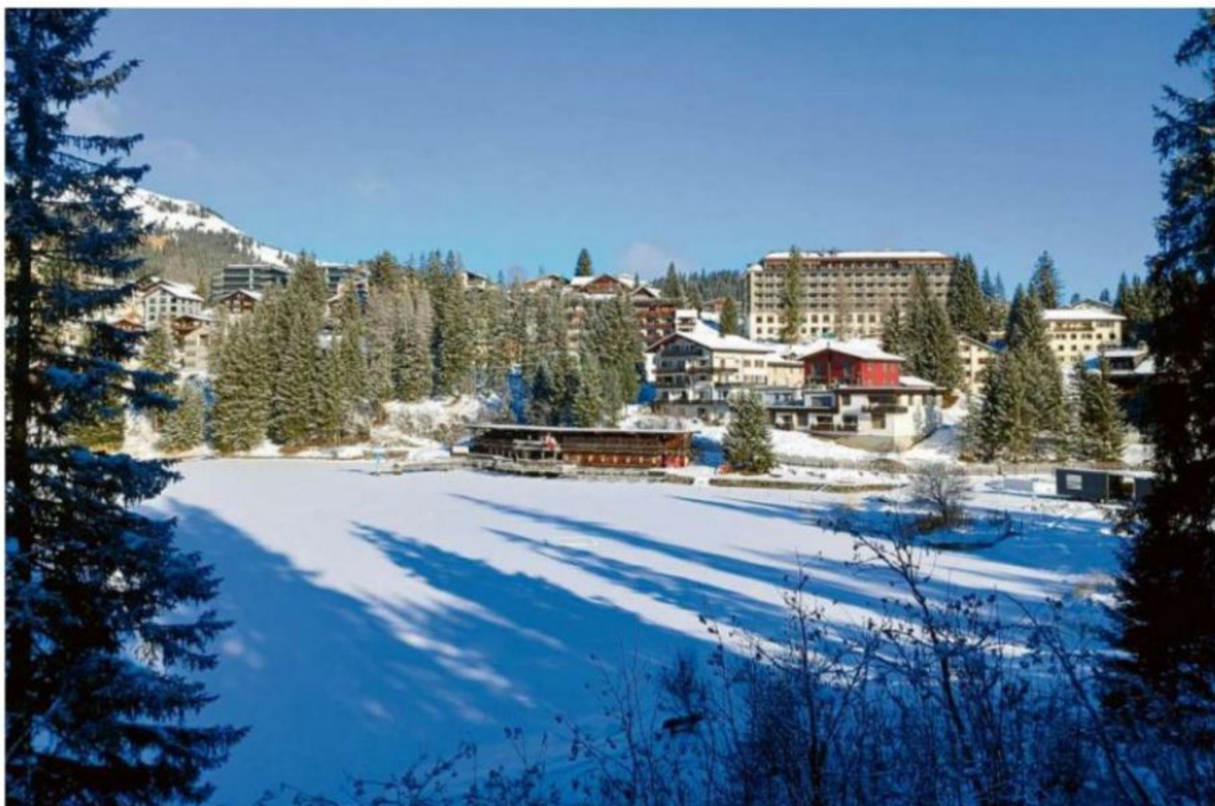
Blick auf den Untersee mit dem historischen Badigebäude von 1948.